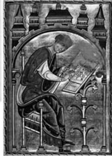
Scriptorium Isidori Hispalensis